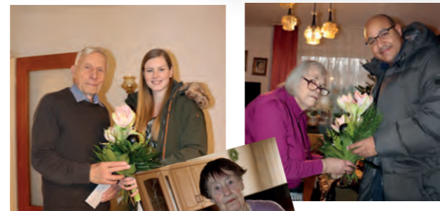
50 Jahre GWG-Treue